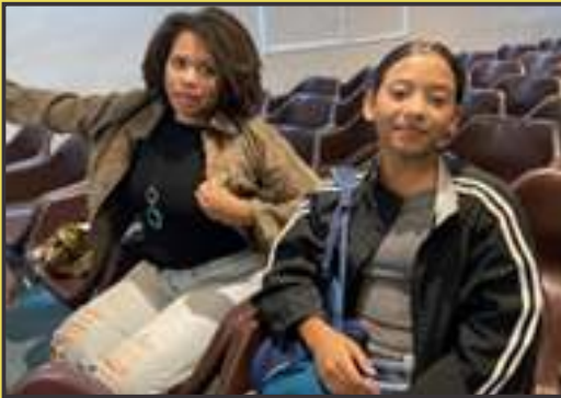
PSIU POÉTICO NO CIEP AYRTON SENNA - ROCINHA