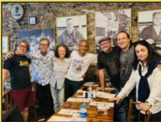
Reunião da equipe de produção com membros do PSIU Poético e APPERJ

Espaços: Teatro Tá na Rua, Academia Brasileira de Letras, Bar do Ernesto, FACHA, Centro Cultural da Justiça, Biblioteca Parque – Rocinha, CIEP Ayrton Senna -Rocinha, Praias de Copacabana e Ipanema.