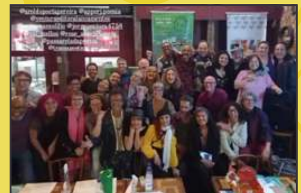
CENTRO CULTURAL JUSTIÇA FEDERAL-CCJF