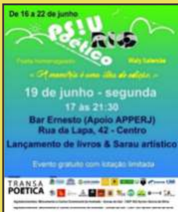
Logos da Ong, Ponto e Ponto de mídia Livre na barra inferiro a direita no flyer.